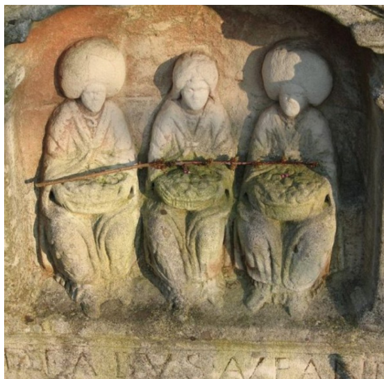
dreifältige Muttergöttin (röm.) Jungfrau ~ Mutter ~ alte Weise